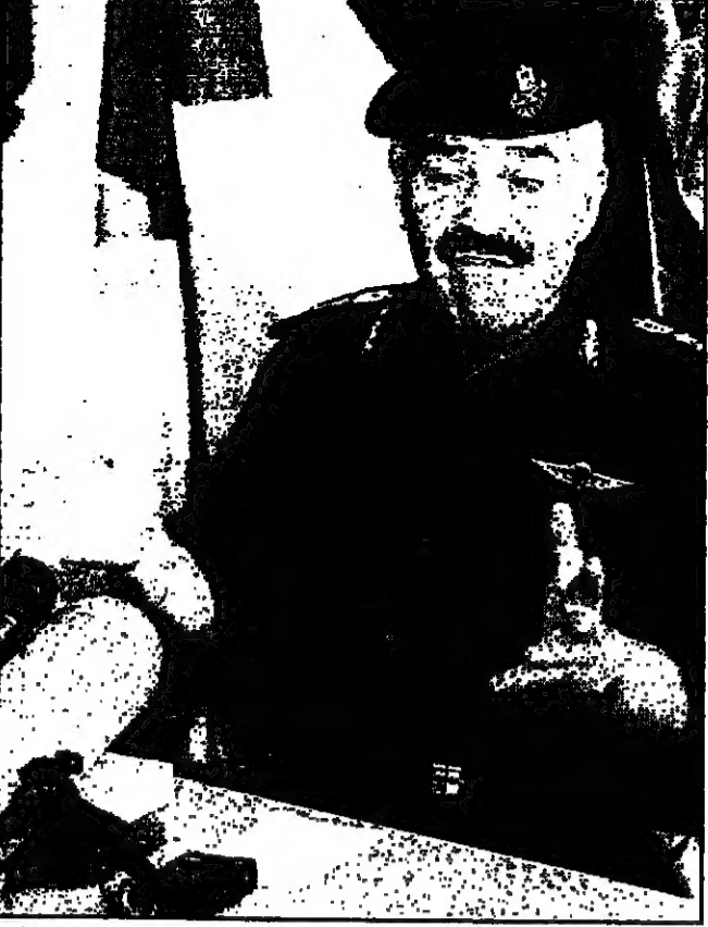
مدير عام الشرطة الفلسطينية غيازي الجبالي يتحدث في المؤتمر الصحافي أمس

غزة 14 آب: أكد مدير العام للشرطة الفلسطينية اللواء غيازي الجبالي اعتقاله، وذلك في اول تصقيب له على اصدار السلطات الاسرائيلية مذكرة توقيف بحقهم، مستخدما على ان الفلسطينيين سيدياهون عن تصديقهم اذا دخل الجنود الاسرائيليون مناطقهم. وقال الجبالي خلال مؤتمر صحافي عقده في غزة مساء الاثنين لا تستطيعون ان تعتقلوني، ولو جازوا (الاسرائيليون) الى هنا الى اي مكان، فن يعودوا ابيدا. واضاف اننا قلنا انهم سيحتفلونني قديما مدة سبب وسبب لاعتقال وزير الدفاع الاسرائيلي او القبطي على جدران من جنرالهم الذين ضربونا في لبنان او ضربونا هنا بعد اطلاق (الحكم الذاتي) او ضربونا في الخليل. واصدرت السلطات الاسرائيلية اسم الخمسين مذكرة توقيف بحق الجبالي، غداة عمليات التفجير الانتحاريين في مجموعته، ووافق اسرقت من مقتل 13 شخصا وجرح أكثر من 150 آخرين اسر الاسرائيلية ان السلطات لا تخفيها في سوريا في الجبالي في العمل، بل تمهده بتوجيه هجمات على المستوطنين الاسرائيليين منذ اسبوعين. واصدرت الحكومة الاسرائيلية، واعتبر بان ليس من حق حكومة اسرائيل ان توجه مثل هذا الكلام الى مدير الشرطة الفلسطينية، وتفي الجبالي الاتهامات الاسرائيلية له بأنه امر رجال الشرطة والقائم بهجمات ضد اهداف اسرائيليه، وصفها بانها مذكرة وايست حاققة.